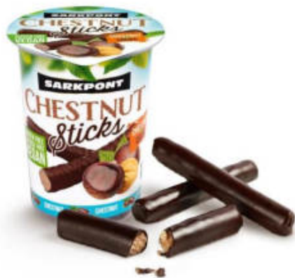
GESZTENYÉS PÁLCIKA NATÚR