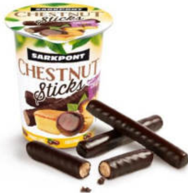
GESZTENYÉS PÁLCIKA PISKÓTÁS