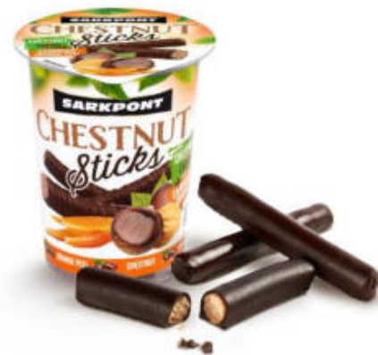
GESZTENYES PÁLCIKA KANDÍROZOTT NARANCOS